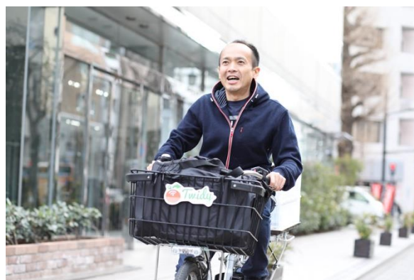
デリバリークルー／お届けイメージ